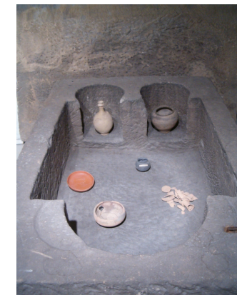
Romeinse askist uit Stein

Omgeving Stein: In Stein zijn meerdere sporen van de Romeinse aanwezigheid gevonden. Rond 1930 is bij het graven van de haven van het Julianakanaal een Romeinse villa blootgelegd. Deze nederzetting was een pleisterplaats voor het verkeer, waar paarden gewisseld konden worden na een dagreis van vele mijlen. De Romeinen hebben duizenden kilometers wegen aangelegd naar alle delen van het rijk om met hun legers overal snel ter plaatse te kunnen zijn. Zo ook aan de oostzijde van de Maas, waar Stein een doorgangsweg was. Zp'n Romeinse lange afstandsweg wordt "heirweg" of "heerstraat" genoemd, verwijzend naar het oorspronkelijke doel van deze wegen (heer – leger), maar ook handelaren maakten gebruik van deze wegen. De maasvaart is ook in deze tijd ontstaan, door de gunstige ligging ten opzichte van Duitsland en Frankrijk. Ze is belangrijk geweest voor de economische ontwikkeling van Elsloo en Urmond. In de directe nabijheid van de Havenstraat zijn Romeinse askisten gevonden, met overblijfselen en tal van bijgiften, die in het museum van Stein zijn te bezichtigen. Het is niet onwaarschijnlijk dat de Romeinse "stenen" nederzetting zijn naam aan het dorp heeft gegeven, zoals ook de naburige Steinakker, Tombe en Heerstraat dezelfde oorsprong verraden. De Romeinen zijn tot ongeveer 450 na Chr. gebleven. Ze werden verdreven door de Franken die van over de Rijn kwamen en heel West-Europa bezetten.