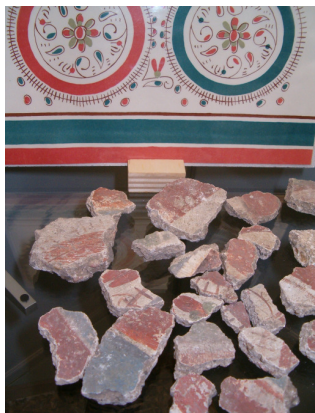
Tegelscherven uit de Romeinse villa te Stein

Omgeving Stein: In Stein zijn meerdere sporen van de Romeinse aanwezigheid gevonden. Rond 1930 is bij het graven van de haven van het Julianakanaal een Romeinse villa blootgelegd. Deze nederzetting was een pleisterplaats voor het verkeer, waar paarden gewisseld konden worden na een dagreis van vele mijlen. De Romeinen hebben duizenden kilometers wegen aangelegd naar alle delen van het rijk om met hun legers overal snel ter plaatse te kunnen zijn. Zo ook aan de oostzijde van de Maas, waar Stein een doorgangsweg was. Zp'n Romeinse lange afstandsweg wordt "heirweg" of "heerstraat" genoemd, verwijzend naar het oorspronkelijke doel van deze wegen (heer – leger), maar ook handelaren maakten gebruik van deze wegen. De maasvaart is ook in deze tijd ontstaan, door de gunstige ligging ten opzichte van Duitsland en Frankrijk. Ze is belangrijk geweest voor de economische ontwikkeling van Elsloo en Urmond. In de directe nabijheid van de Havenstraat zijn Romeinse askisten gevonden, met overblijfselen en tal van bijgiften, die in het museum van Stein zijn te bezichtigen. Het is niet onwaarschijnlijk dat de Romeinse "stenen" nederzetting zijn naam aan het dorp heeft gegeven, zoals ook de naburige Steinakker, Tombe en Heerstraat dezelfde oorsprong verraden. De Romeinen zijn tot ongeveer 450 na Chr. gebleven. Ze werden verdreven door de Franken die van over de Rijn kwamen en heel West-Europa bezetten.